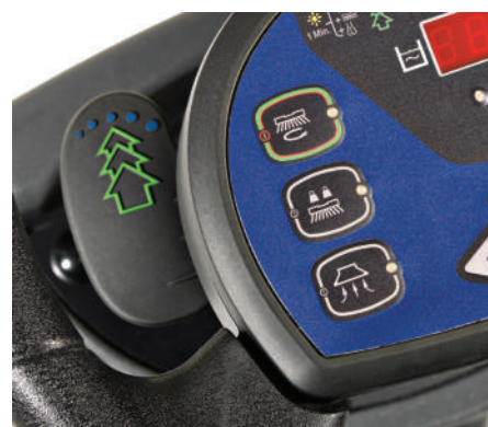
Levetta per attivare e disattivare l'Ecoflex