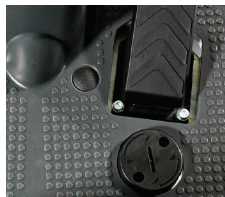
Pedale elettronico con sistema di regolazione del tallone (brevettato) per eliminare lo stress del piede destro